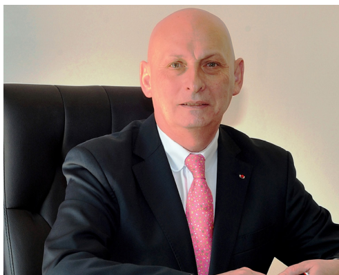
amb. Tomasz Orłowski