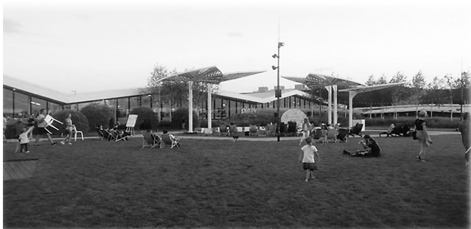
Fot. 1. Dach Galerii Północnej w Warszawie