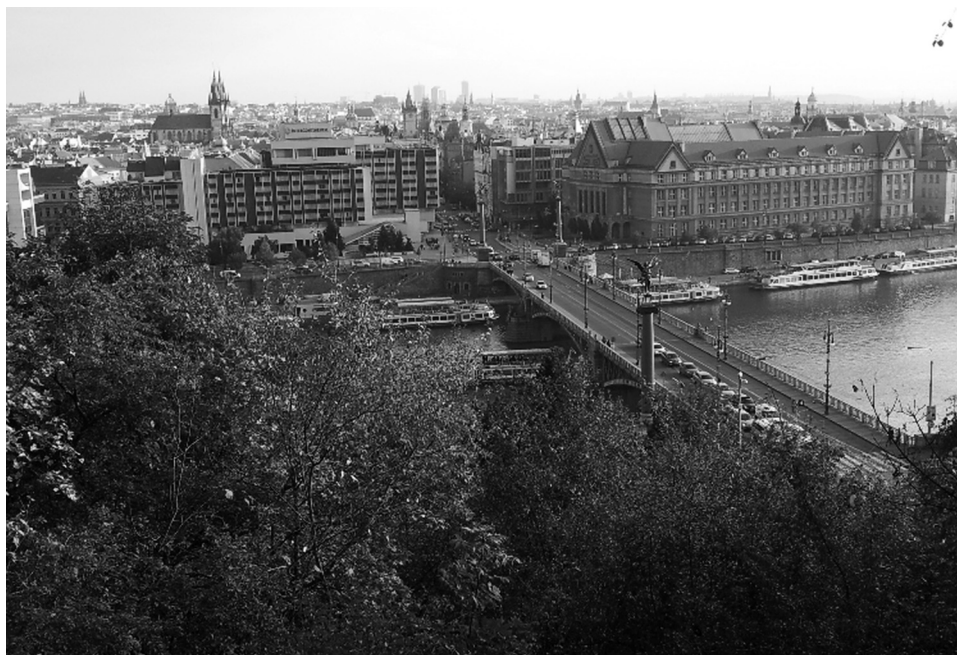
Fot. 2. Letenské sady – widok z parku

słupem” zieleni miejskiej. W latach 70. XX w. w Pradze zaplanowano utworzenie pierścieniowo-klinowego systemu miejskiego. Tereny zielone obejmują istniejącą zieleni i tworzą stosunkowo spójny system. Od lat 90. XX w. władze miejskie kładą szczególny nacisk na renowację i rekonstrukcję istniejących ogrodów 39 .