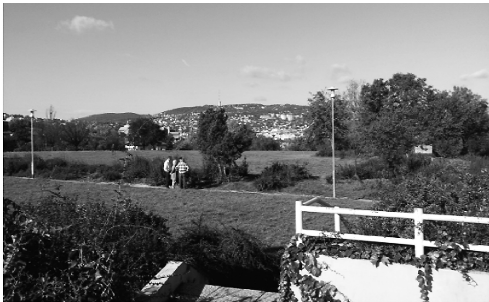
Fot. 3. Zielone wzgórze w zachodniej części Budy

Tereny zielone są dominujące na północnym zachodzie i zachodzie, w części Budy (fot. 3). Wschodnia część miasta – Peszt – cechuje się bardziej zwartą zabudową i mniejszą ilością zieleni. W centrum i na południu znajduje się natomiast dużo terenów otwartych. Sprzyja temu bardziej równinny krajobraz. Wśród najbardziej popularnych terenów rekreacyjnych wymienić można: w zachodniej części miasta Sas-hegy, w centrum Gellért-hegy (Góra Gellerta), południowa wyspa nad Dunajem Háros-sziget i sztuczna Wyspa Małgorzaty w centrum. W Budapeszcie (w części Buda) znajduje się również wiele ciekawych obiektów przyrody nieożywionej, takich jak np. jaskinie (najdłuższy system jaskiń ma 29 km – Jaskinia Pálvölgyi i Jaskinia Mátyás) oraz wody geotermalne (w rejonie Budy) 48 .